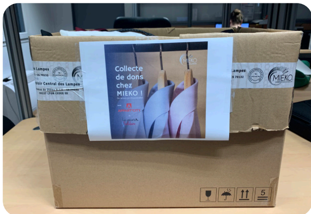
Collecte Cravate Solidaire 2022

- Collectes et dons sont effectués dès que nous le pouvons, ce qui permet à nos salariés de contribuer à des projets solidaires et de participer à l'engagement social de notre entreprise.