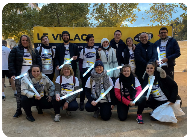
Course des lumières 2021

- Organisation d'événements en interne pour renforcer l'esprit d'équipe et la cohésion entre nos salariés. Les team building sont des moments privilégiés pour se rencontrer, se découvrir et partager des moments conviviaux. (Course des lumières, Ruée des Fadas...)